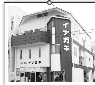
名古屋本店 駅近 P10台