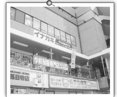
甚目寺店 駅近 P30台