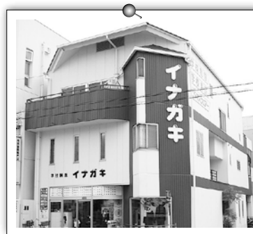
名古屋本店 駅近 P10台