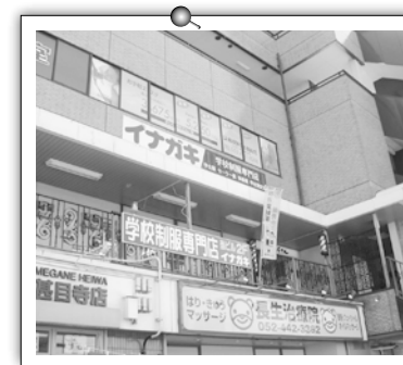
甚目寺店 駅近 P30台