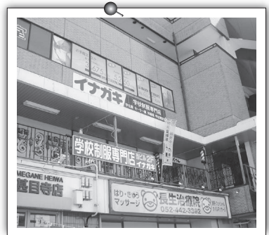
甚目寺店 駅近 P30台