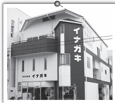
名古屋本店 駅近 P10台